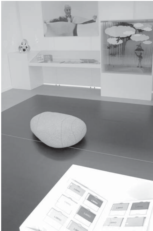
Module blanc et noir pour Bruno Munari et Remy Charlip.